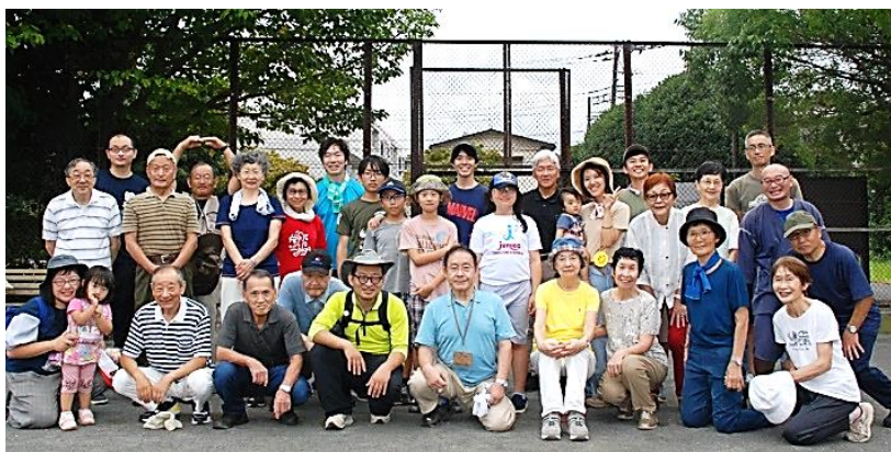
↑世代を超えてお集りの、参加者の皆さん